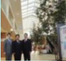
ホスピタルストリート