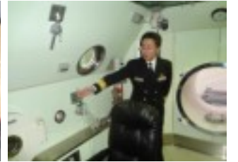
高気圧酸素治療装置