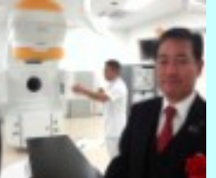
定位放射線治療装置