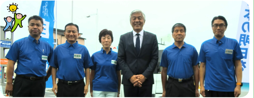
7/8 参議院選挙 鴻巣駅前街頭演説会にスポーツライター青島健太さんが応援に駆けつけてくださいました。