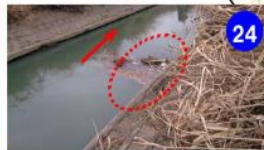
背面土砂吸出しによる 護岸変状