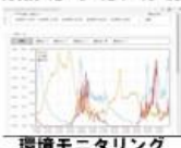
環境モニタリング (データ共同活用)