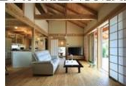
県産木材を活用した住宅