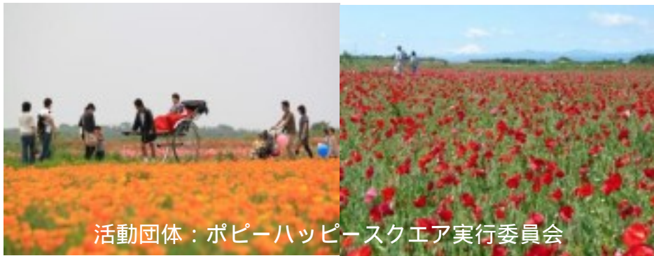
活動団体：ポピーハッピースクエア実行委員会

ポピーハッピースクエアでは、荒川河川敷のゴミ不法投棄防止と花のまちづくりのすをアピールすることを目的に約12.5ヘクタールの敷地に1千万本のポピーが栽培されています。