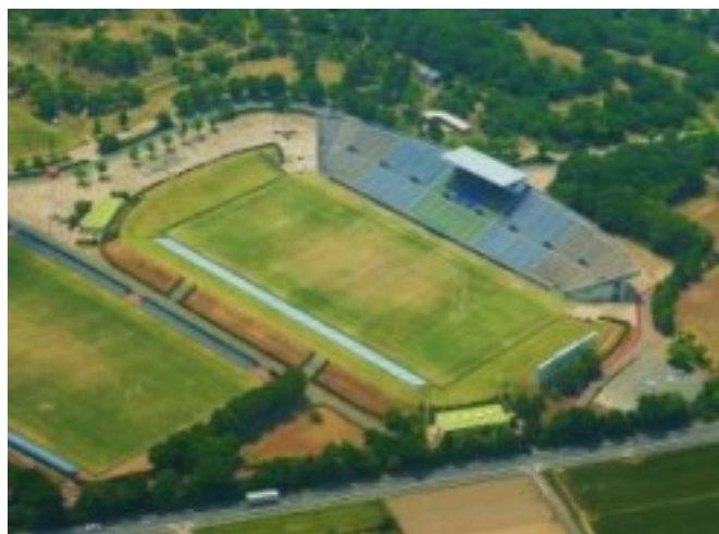
現在のラグビー場