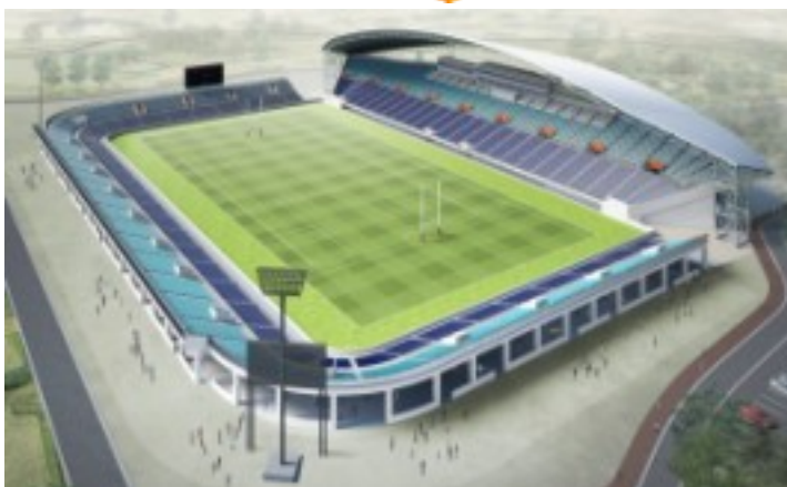
埼玉県参考資料より