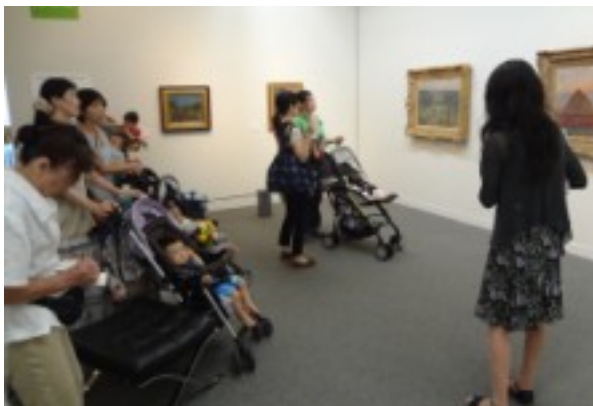
2013/7/19 県立近代美術館でのファミリー鑑賞会