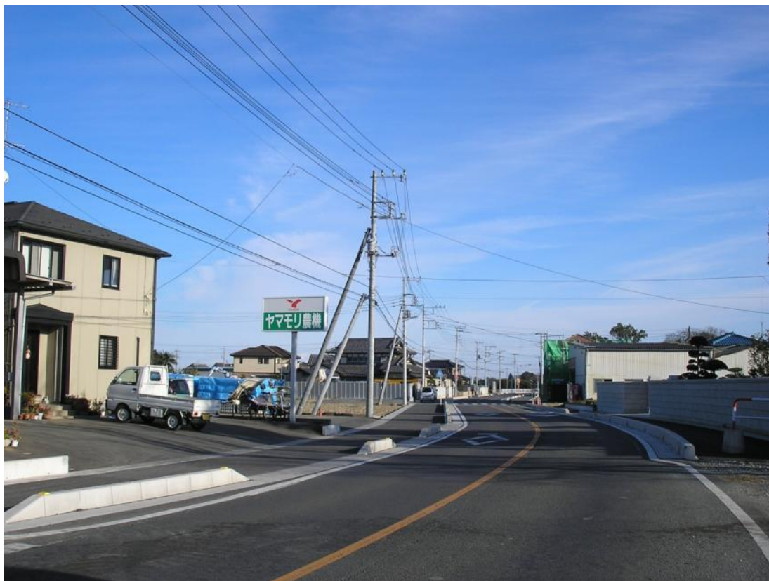
舗装道路整備 行田蓮田線（郷地）