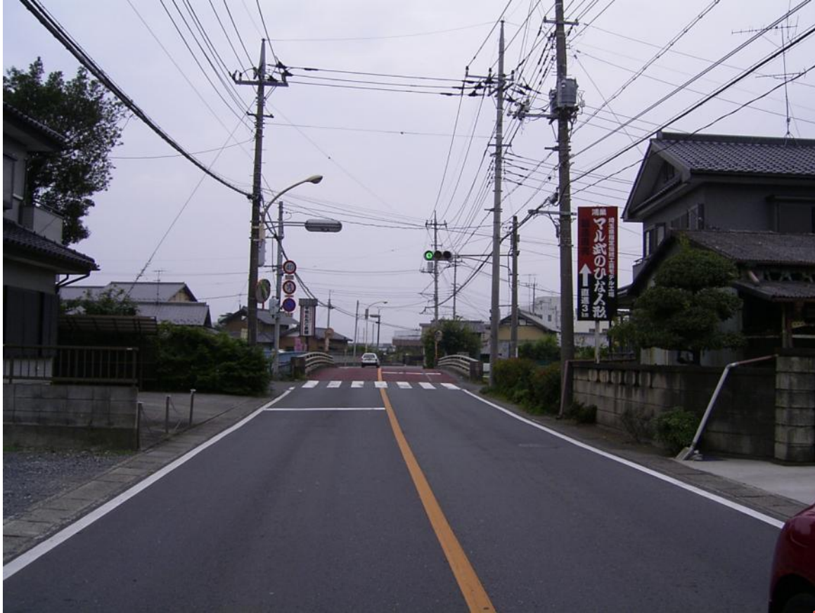
加須鴻巣線（笠原大橋 左岸）