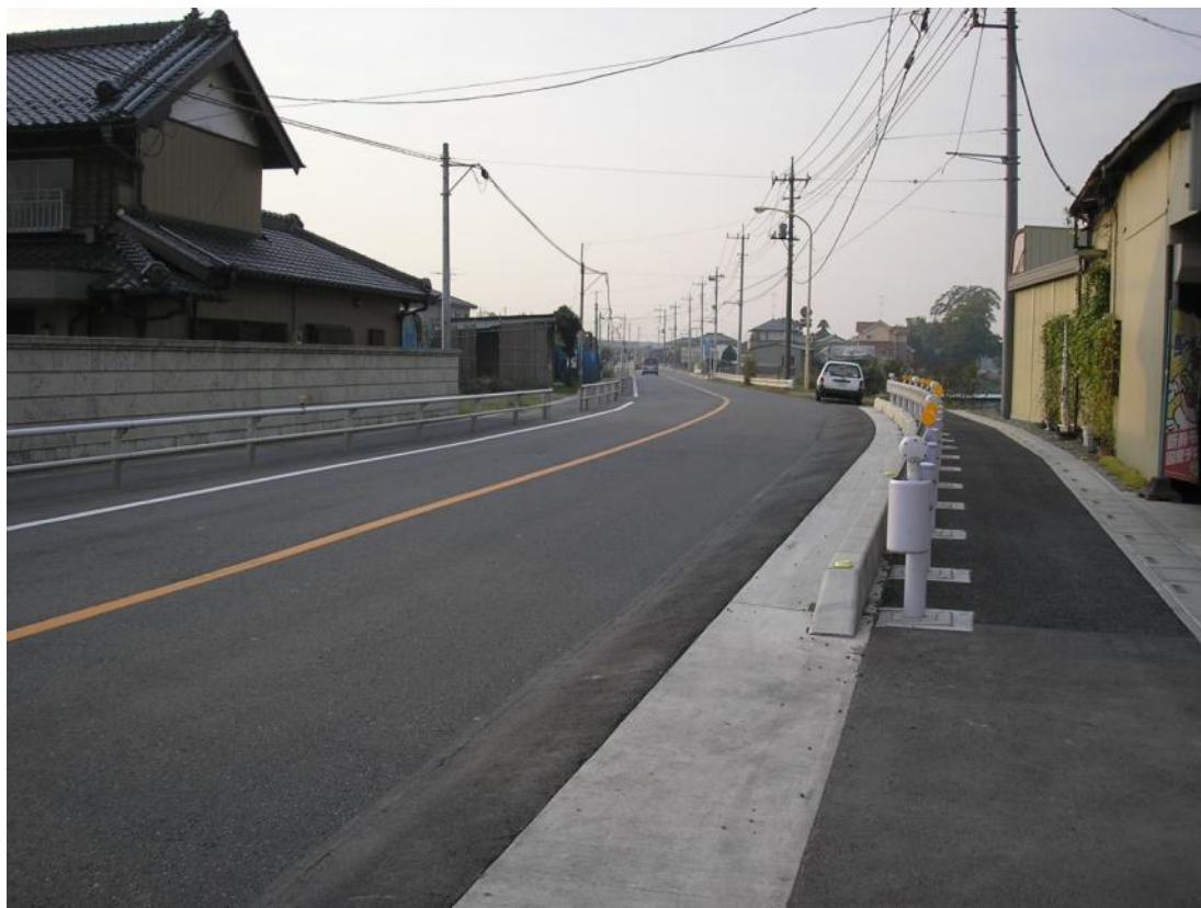
舗装道路整備 加須鴻巣線（上谷）