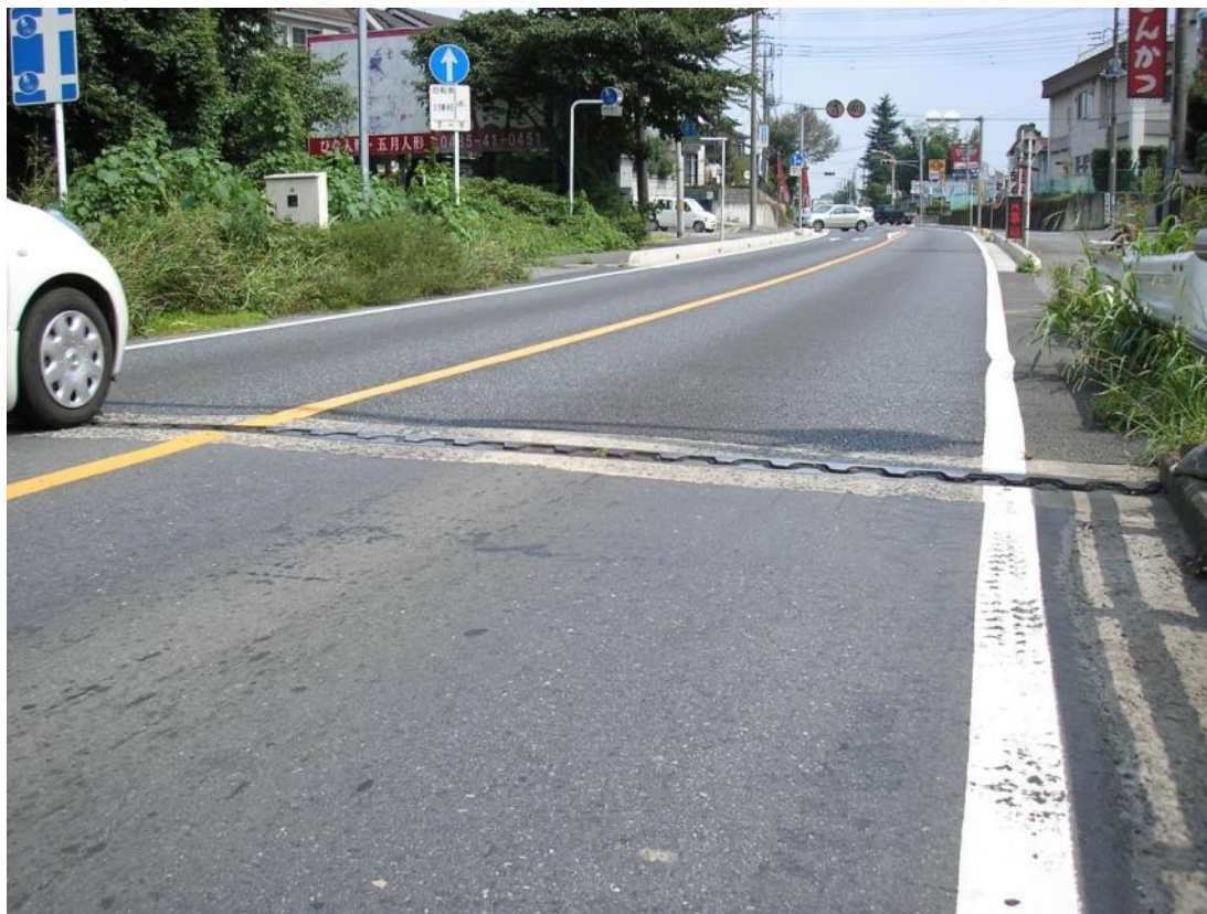
地方特定道路（維持）整備 東松山鴻巣線（御成橋）