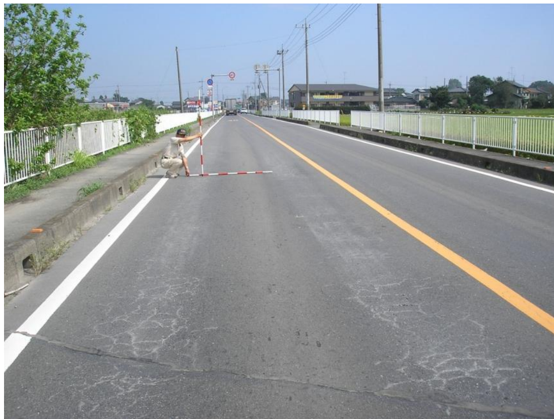
舗装道路整備 行田東松山線（大芦）