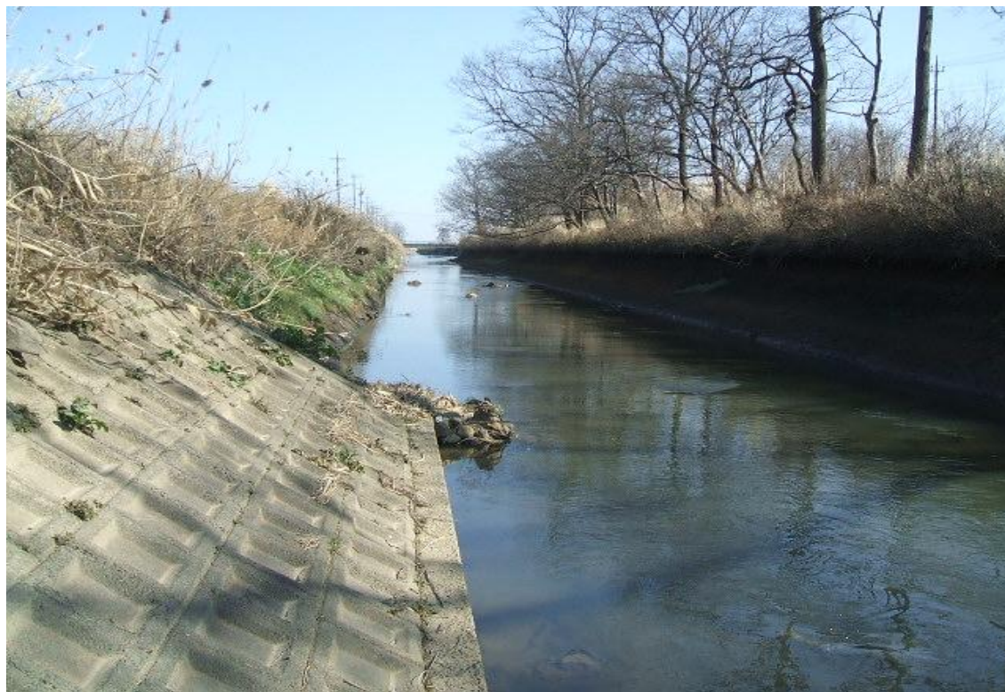
河川改修 野通川(野通橋下流200m上流から下流を望む)