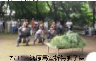
7/11 鴻巣原馬室祈禱獅子舞