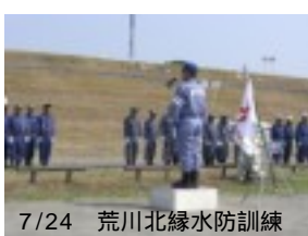
7/24 荒川北縁水防訓練