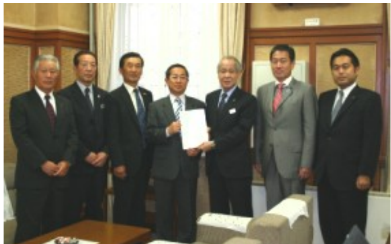
10/20 鴻巣市は県へ「彩のかがやき」の被害対策への要望をしました。

8月半ばから9月上旬の未曾有の高温と降水量0の時期に遭遇してしまつた稲が、耐えうる限界を超えて高温障害を起こしてしまつた。県としては、高温に対応した技術対策について詳細な検討を進めて参ります。そして、県が先頭に立つて、さまざまな関係団体や県内企業、多くの県民の方々に広く協力を呼びかけ、販売促進に努めて参ります。また、生産農家の収入減に対しても、様々な視点から一生懸命に検討を進めて参りたいと思っております。