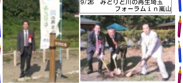
9/26 みどりと川の再生埼玉フォーラム in 嵐山