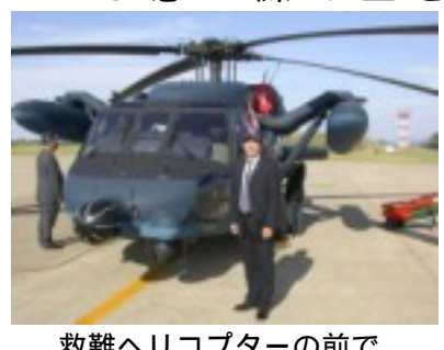
救難ヘリコプターの前で

感謝した。国土 防衛のために日々 厳しい訓練を繰 り返す自衛隊。 隊員各位に、感 謝と敬意を感じ た視察だった。