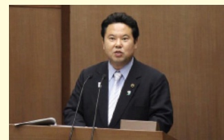
県政のみならず、国政にも繋がる分野にも鋭く迫りました!