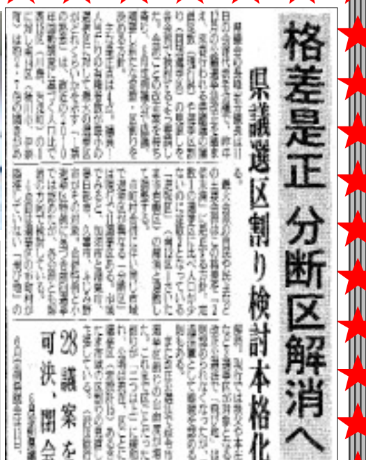
7/12 埼玉新聞記事より

「なかやしきの思い」 平成21年末から販売されている子宮頸がんワクチン。接種後の副反応として特に問題になっている症例は全国で176件。多くの若い女性が辛い思いをしている。国は、1日も早い原因究明を責任もってしなければならぬ。併せて、子宮頸がんを始めとする病気に対する検診の受診率を飛躍的に上昇させる工夫も必須。