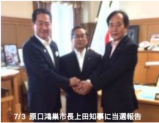
7/3 原口鴻巣市長上田知事に当選報告