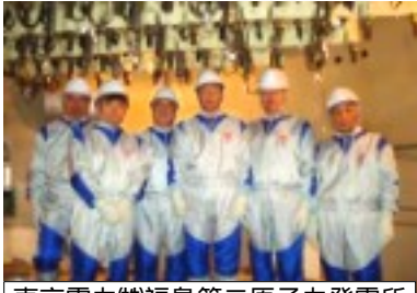
東京電力(株)福島第二原子力発電所