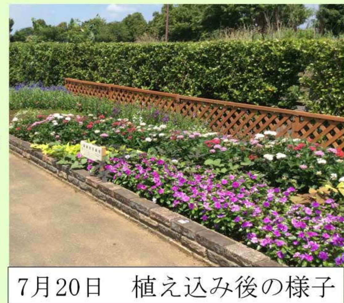
7月20日 植え込み後の様子

皆さんを中心に、官民挙げたオール鴻巣での取り組みにしていかなければならないですね。