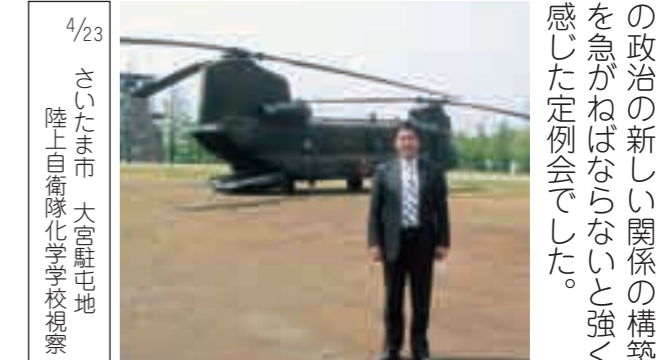
さいたま市 大宮駐屯地 陸上自衛隊化学学校視察

書」。総務県民生活委員会委員提案による「法務局の統廃合に当たり、廃止庁が所在する市・区役所等への証明書発行請求機の設置を求め意見書」私も委員として所属している警察危機管理防災委員会委員提案による「警察官の増員を求め意見書」の4つの意見書が衆参両院議長・内閣総理大臣および関係各大臣に提出されました。