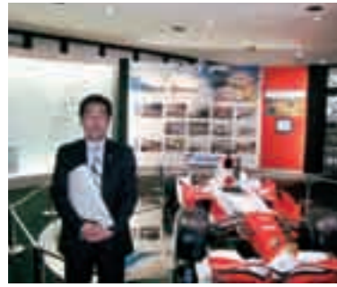
トヨタ会館視察「F1レースカー」